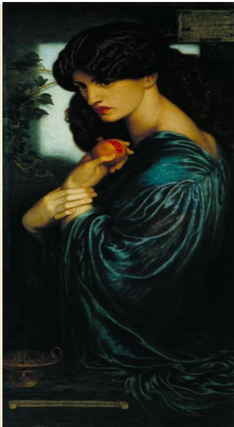
Vrouw met granaatappel, Dante Gabrielle Rosetti