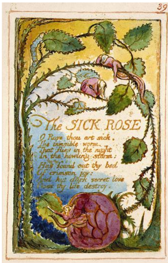
William Blake, The sick rose